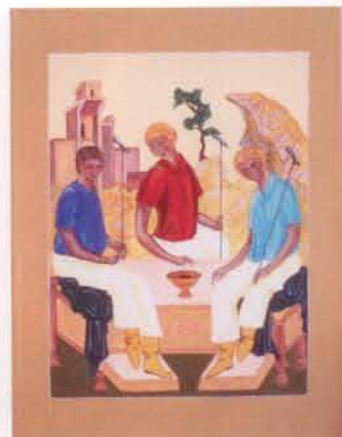
Bröderna Herrey i sina gyllene skor.