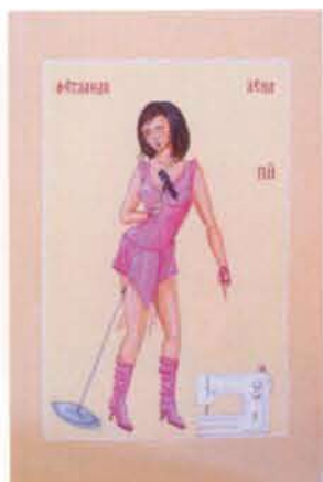
Lena Philipsson med sin symaskin.