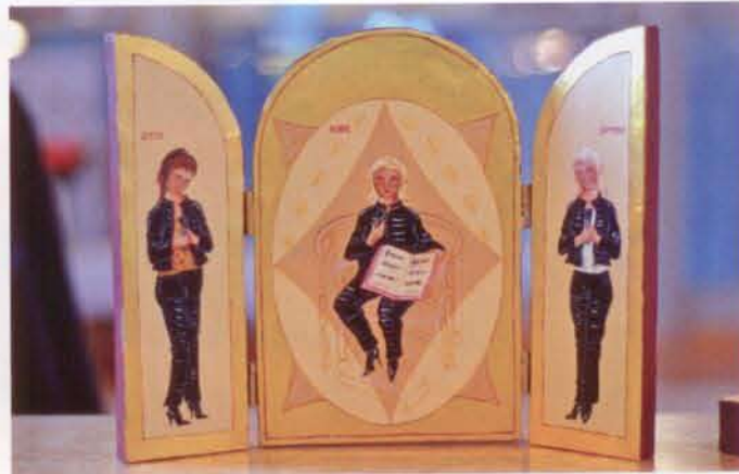
Altarskåp med Lotta, Kicki och Bettan. Noterna till låten »Vem är det du vill ha?«, är ditmålade med knappnål.